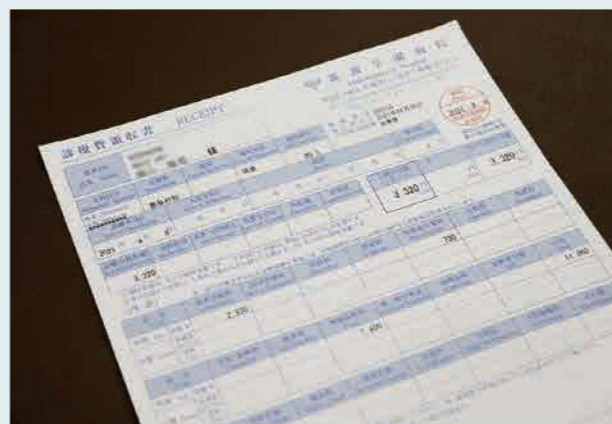
当院で使用している実際の診療費領収書。保険点数が書かれた診療明細書も併せて発行している。

領収書に話を戻しましょう。皆さんが支払った残りの7割は、ご存じの通りご加入の保険組合が負担しています。右上の図をご覧ください。病院では会計が終わった患者さんごとに「レセプト」という書類を作成し、お勤め先の会社や市町村等の「保険者」に請求しています(ちなみにレセプトはドイツ語で、元は病院の処方箋の意味だそうです)。例えば、その月の診療報酬は月末で締められ、翌月10日までに審査支払機関にレセプトを提出します。当院も含め、多くの医療機関では電子化が進んでいるためレセプトは自動算定されますが、提出前に人間の目でチェックする必要があります。医療保険の対象となっている薬や診療行為にはどんな病気に対して適用されるかが法律で決まっているため、患者さんの症