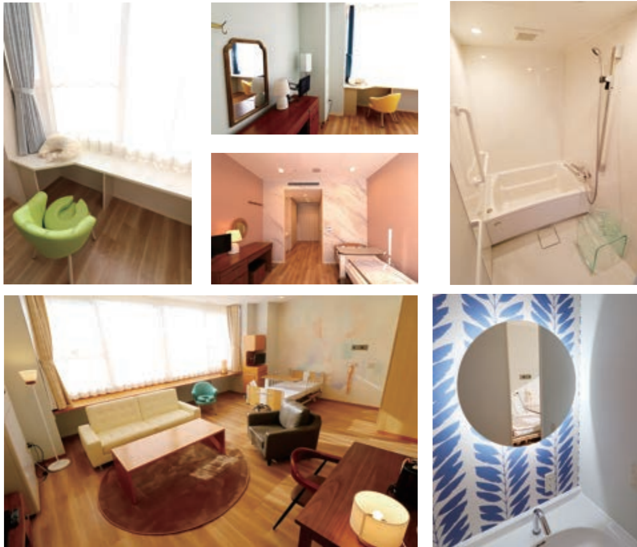
新しくなった個室。部屋ごとにさまざまな表情を見せ、産婦さんがリラックスできる空間を演出