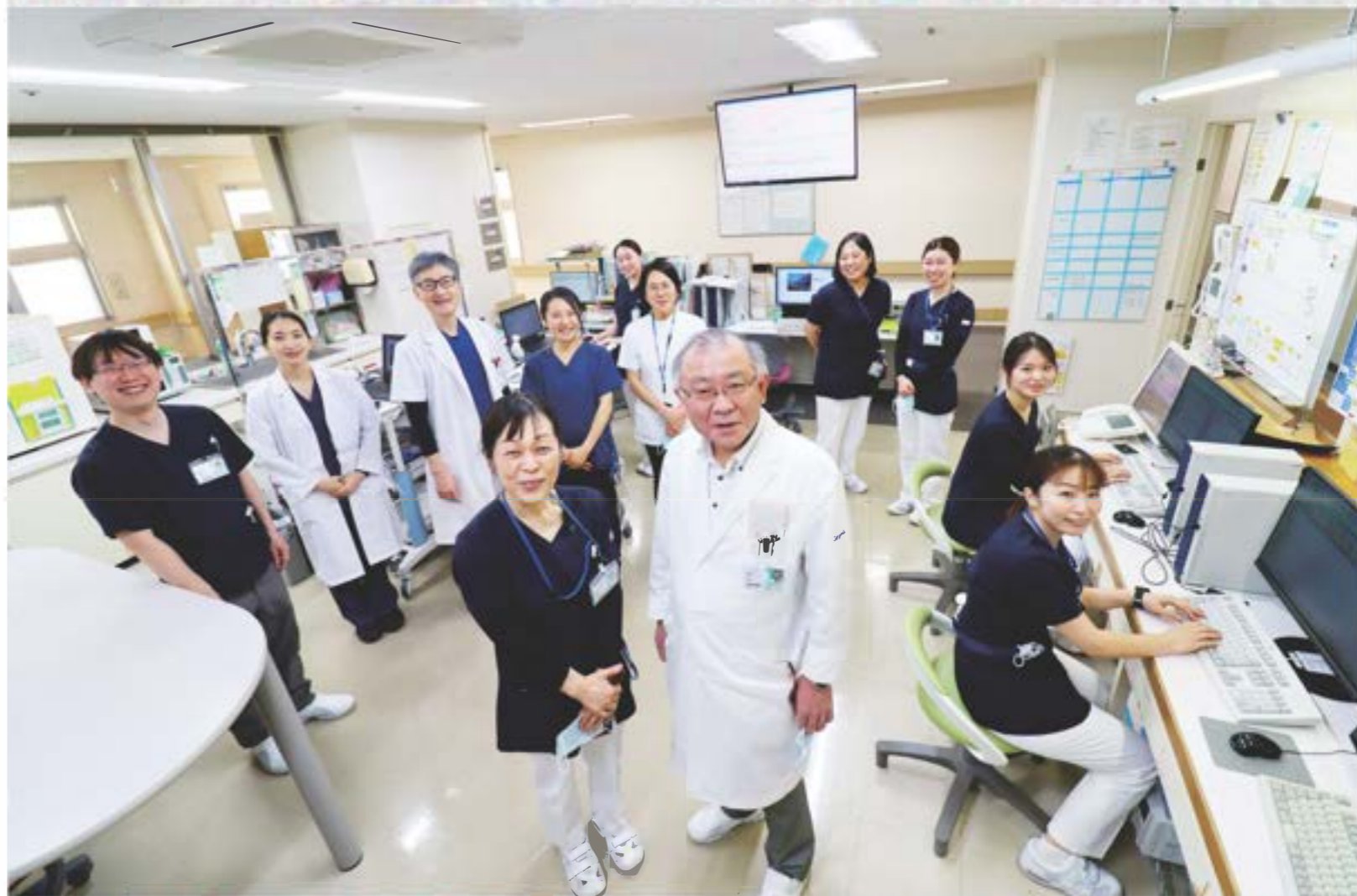
岡本副病院長兼産婦人科部長と飯田産科病棟師長（中央）を囲み、産婦人科医師、小児科医師、助産師ら産科病棟スタッフたち

さかのぼること38年前、当院産科病棟が産声を上げました。産婦さんに寄り添い、たくさんの命が誕生する現場で、日々安心安全なお産に従事するスタッフ。今回の特集では、歴史ある産科病棟をご紹介します。