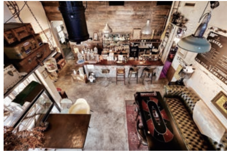
店内にはオーナーがアメリカを中心に買い集めたビンテージ家具が並ぶ

「ロボットと生物の一番の違いは何か」。高校の授業で問われた。「子どもを産み、育てること」。意外な答えだったが、妙に納得した。医師となり関東近県の病院で婦人科内視鏡手術の腕を磨く中で転機が訪れた。重い子宮筋腫を患う女性との出会い。手術は成功したが、高齢もあって妊娠できる可能性を残せなかった。「もっと早く相談してくれていたら」と後悔に似た思いを抱き、筑波学園病院に入職して手術や分娩だけでなく高度生殖医療も学んだ。 一昨年クリニックを開業し、子宮鏡手術件数は全国トップクラス。「婦人科診察は恥ずかしい」との声を反映し待合ソファの配置にも気を配る。学業、仕事、育児、介護などで忙しい女性が健康管理を後回しにせず、気軽に相談できる場をつくり「自分を大切にできるような予防診療を進めたい」。