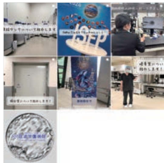
産婦人科(リプロダクションユニット)のInstagram投稿画面

① 閲覧方法 ① あらかじめInstagramアプリをインストールしてください。